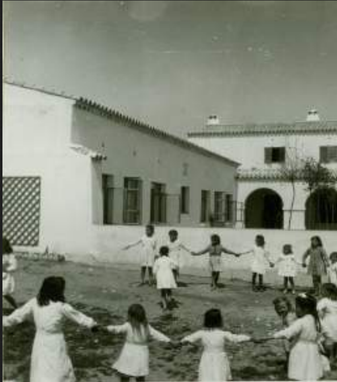
Patio de la escuela de niñas en El Torno. Alrededor de 1950.