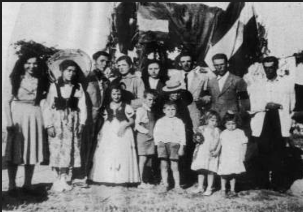
Familia de romería. Años 50.