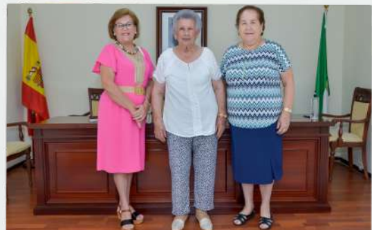
REINAS Y DAMAS TERCERA EDAD