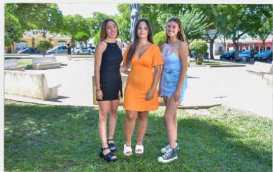
REINAS Y DAMAS JUVENILES