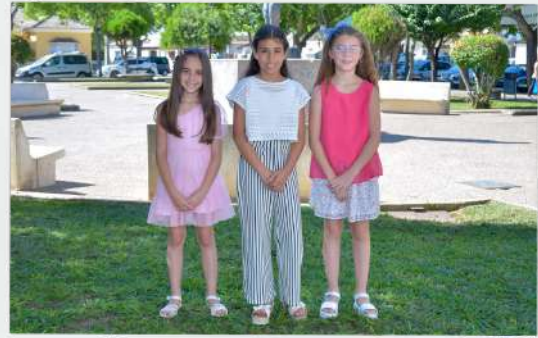
REINAS Y DAMAS INFANTILES